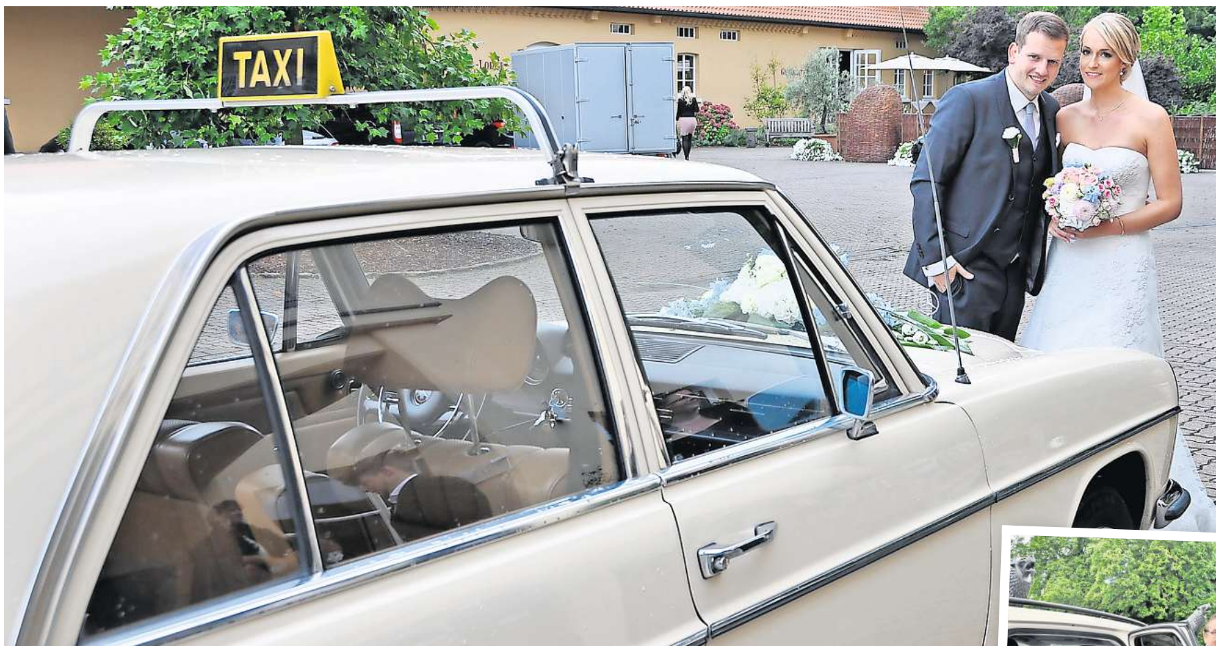
Hallo Taxi 3811-Wir fahren Sie ins Glück.

Einer der Vorteile gegenüber Mitbewerbern: Hallo Taxi schickt direkt das Fahrzeug, das in der Nähe des Kunden steht. Dadurch werden unnötig lange Fahrten von der Bestellung bis zum Kunden vermieden. Das schont die Umwelt und spart Kosten. „Wir sorgen so dafür, dass unser Fahrgast sein Ziel schnell und ohne Umwege er-